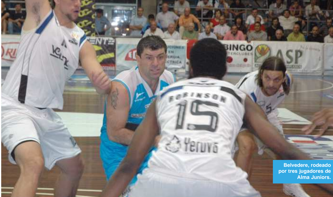
Belvedere, rodeado por tres jugadores de Alma Juniors.