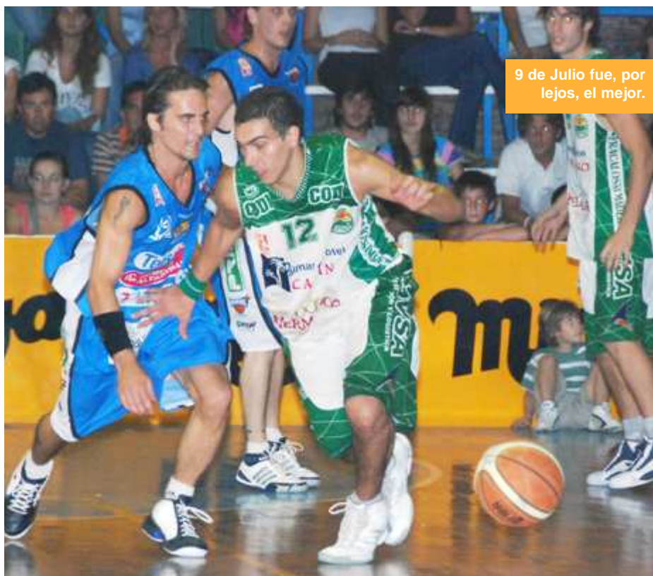
9 de Julio fue, por lejos, el mejor.

Lo concreto es que ahora ambos equipos mediterráneos deberán esperar rival para los cuartos de final. Mientras la Reclasificación se disputa, ellos gozarán de un merecido descanso, como para recargar pilas y recuperarse a pleno para la parte más importante de la temporada: los playoffs camino al ascenso al TNA.