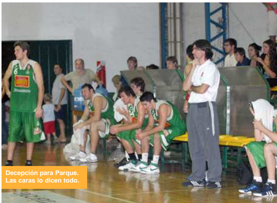
Decepción para Parque. Las caras lo dicen todo.

No siempre los objetivos se condicionan con los resultados, y con esa lastimosa realidad tropezó Barrio Parque en la noche del pasado domingo 29 de marzo, cuando, obligado a ganar, perdió como local ante Anzorena de Mendoza 83-79 y descendió a la Liga Cordobesa después de mantenerse durante cuatro temporadas en la tercera categoría del básquet argentino.