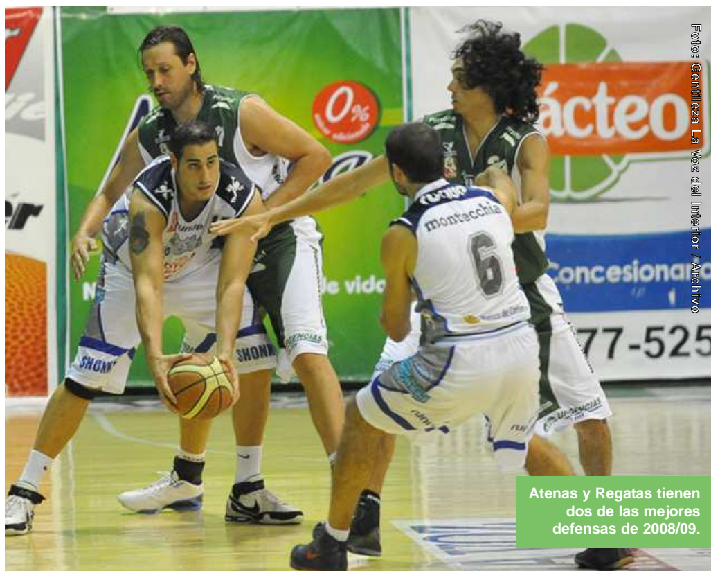
Atenas y Regatas tienen dos de las mejores defensas de 2008/09.

Si bien el balance de victorias y derrotas favorece por lejos a Atenas (33-11 contra 22-22), los correntinos pueden tutear al griego en un rubro clave: la defensa, caballito de batalla de los verdes. De los ocho que se metieron en cuartos de final, los "remeros" son los únicos que están cerca del griego: Atenas es el que menos puntos en contra recibió, 69 en todo 2008/09. Regatas sufrió sólo 70,6.