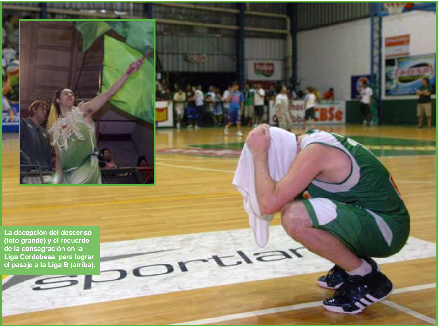
La decepción del descenso (foto grande) y el recuerdo de la consagración en la Liga Cordobesa, para lograr el pasaje a la Liga B (arriba).