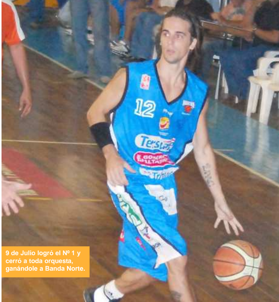
9 de Julio logró el N° 1 y cerró a toda orquesta, ganándole a Banda Norte.