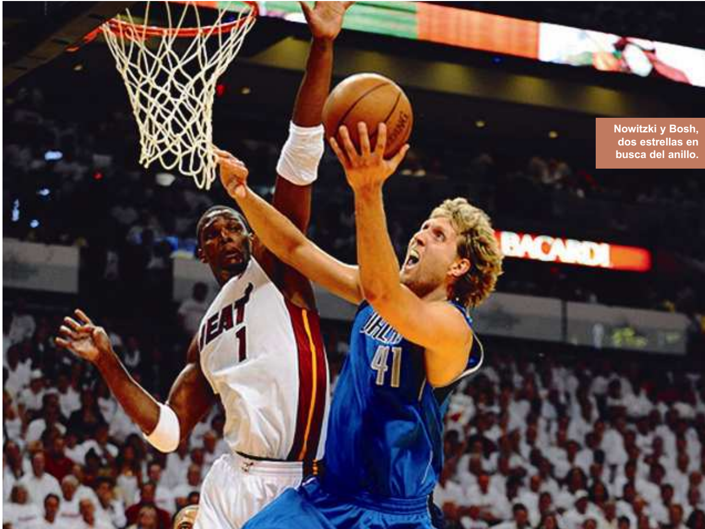
Nowitzki y Bosh, dos estrellas en busca del anillo.